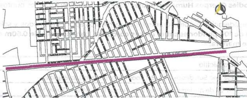
Av. Dr. Rafael Cuervo, desde calle Joaquín Perea Blanco hasta Av. Cuauhtémoc