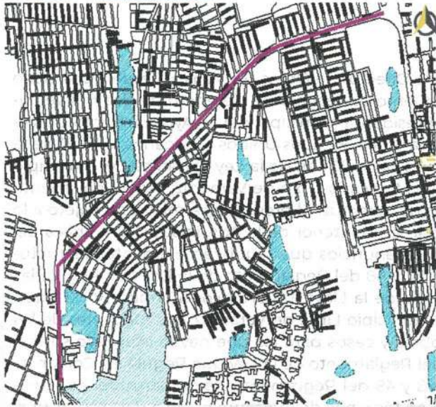
Eje Uno Sur, desde Av. J. B. Lobos hasta entrada Las Bajadas