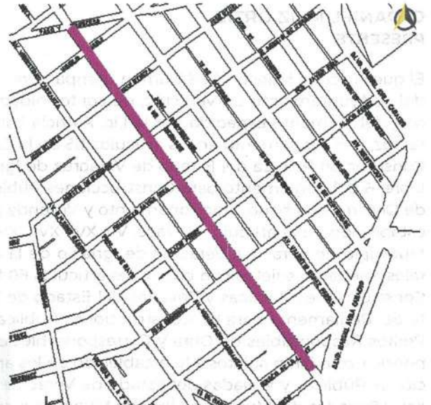
Av. Primero de mayo desde Av. Paso y Troncoso hasta calle 18 de marzo