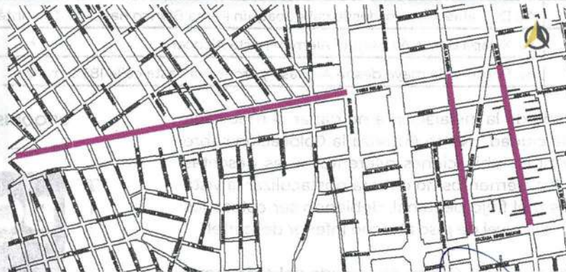
Av. Xalapa desde Av. Miguel Alemán hasta Alcocer Av. Lafragua, desde Calz. Simón Bolívar hasta Tuero Molina Av. 20 de noviembre, desde Calz. Simón Bolívar hasta Tuero Molina