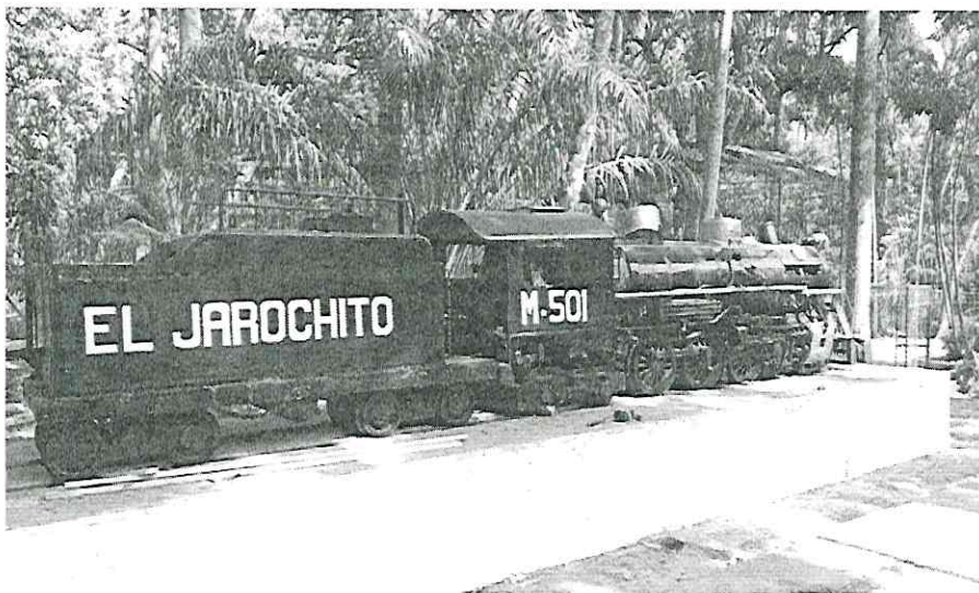
Locomotora de Vapor a escala “El Jarochito”